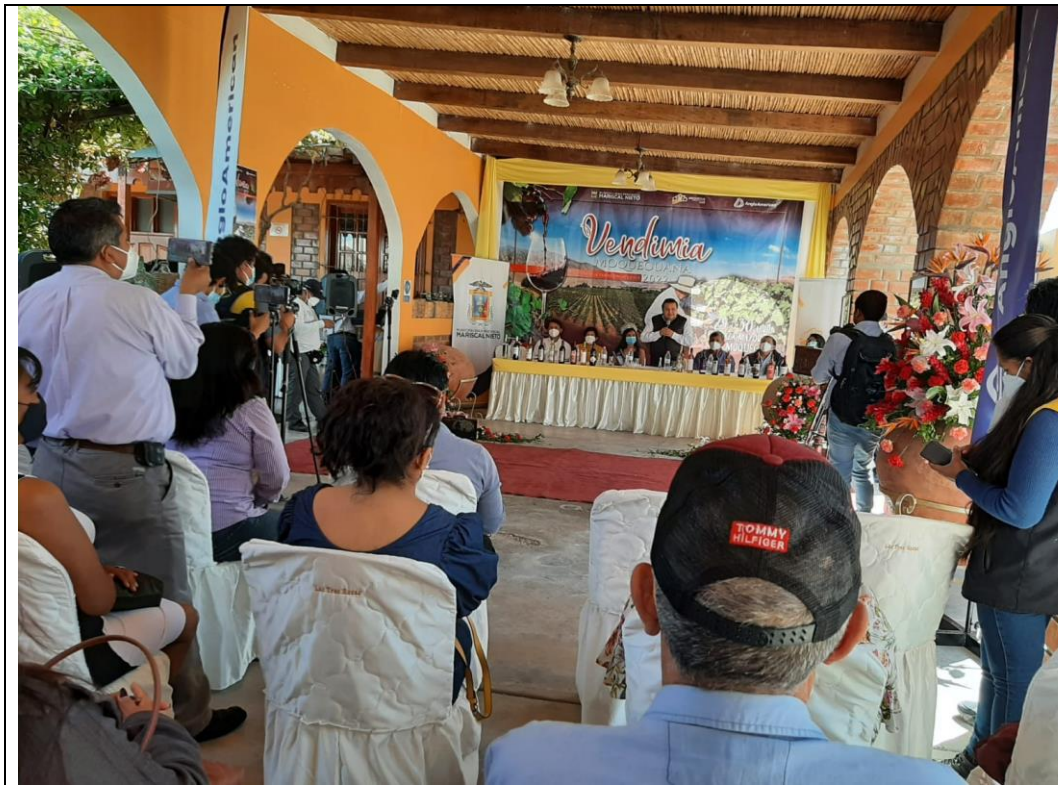
IMAGEN N° 11: ACTIVIDADES DE FORTALECIMIENTO DE LA ACTIVIDAD TURÍSTICA Y ARTESANAL EN LA PROVINCIA MARISCAL NIETO.