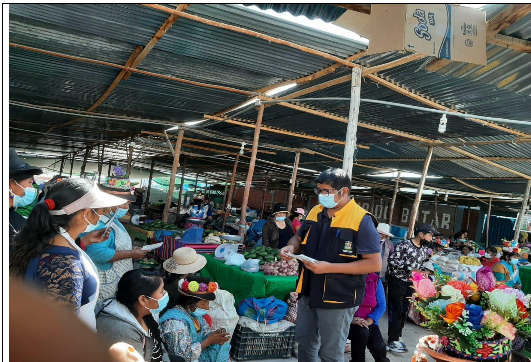
IMAGEN N° 07: ACTIVIDADES DE FOMENTO DE ASPECTOS SANITARIOS