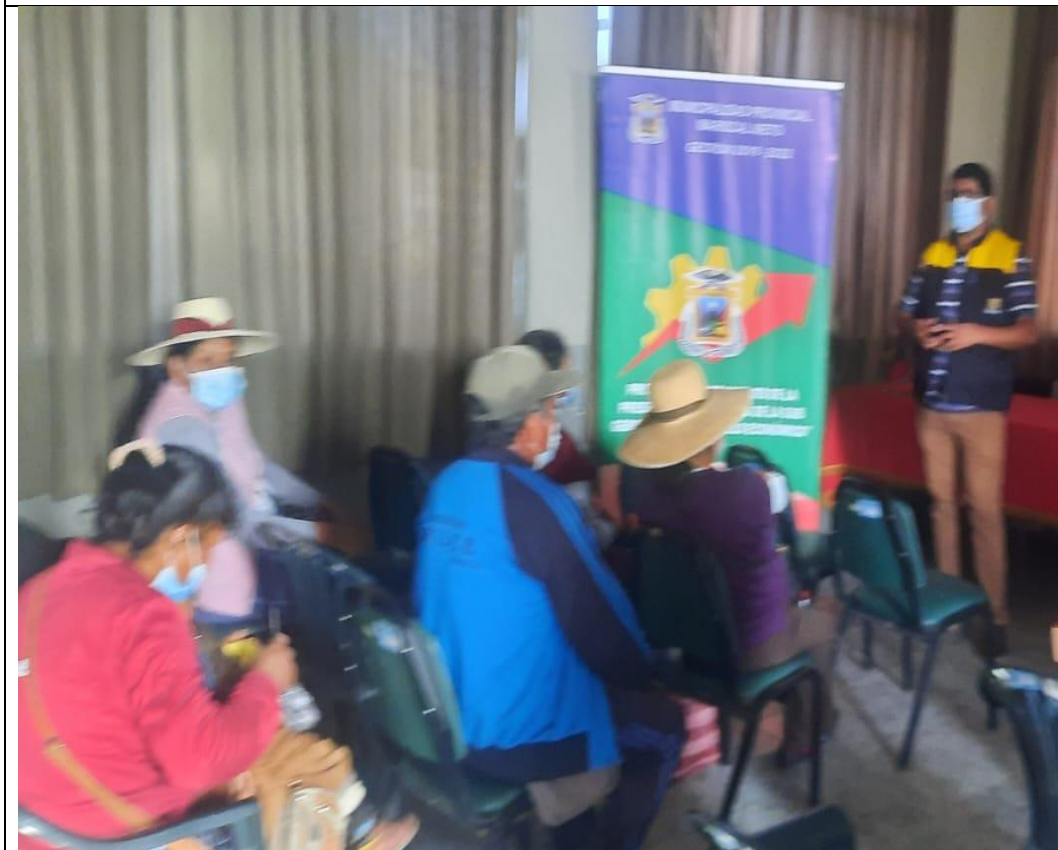
IMAGEN N° 06: ACTIVIDADES DE FOMENTO DE ASPECTOS SANITARIOS