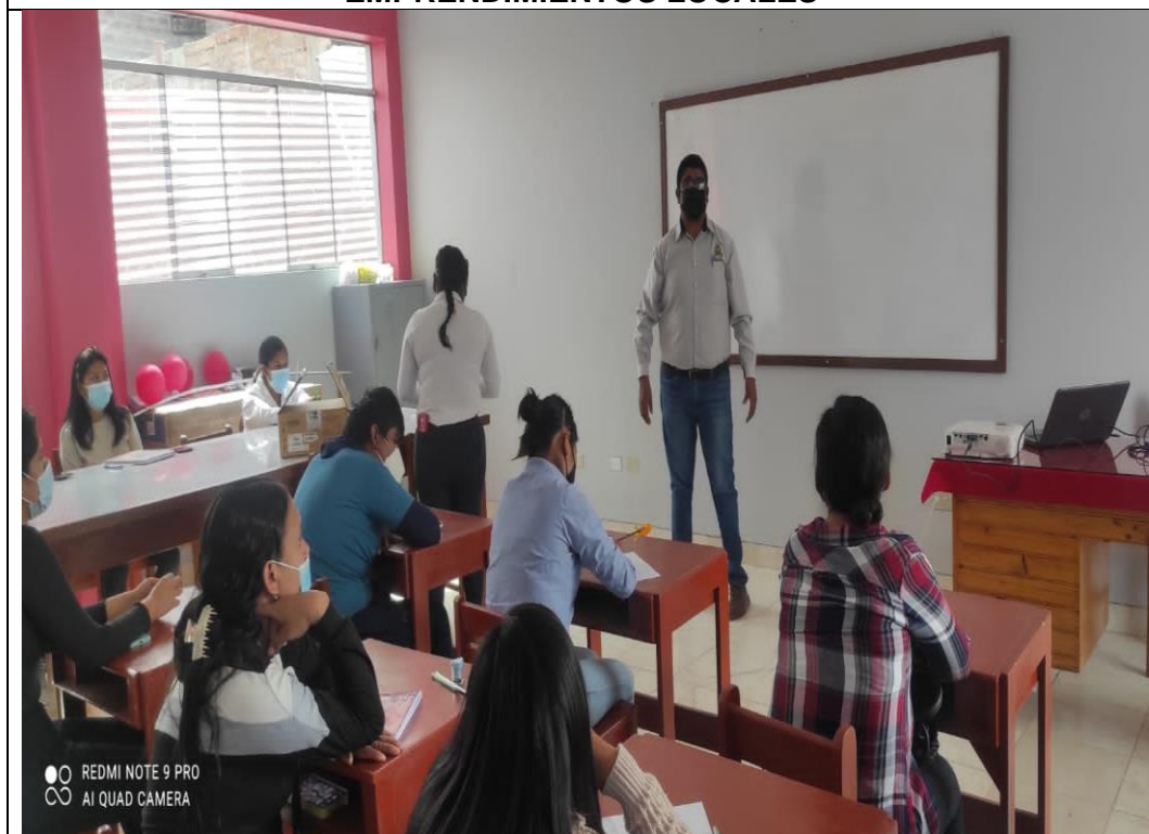
Imagen N° 02: ACTIVIDADES DE FORMALIZACIÓN DE MYPES Y EMPREDIMIENTOS LOCALES