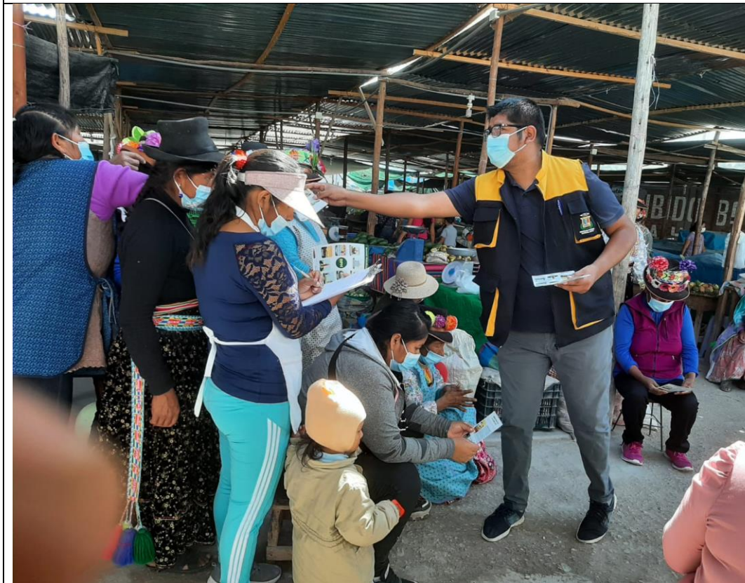
IMAGEN N° 08: ACTIVIDADES DE FOMENTO DE ASPECTOS SANITARIOS