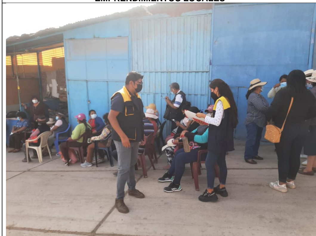
Imagen N° 04: ACTIVIDADES DE FORMALIZACIÓN DE MYPES Y EMPRENDIMIENTOS LOCALES