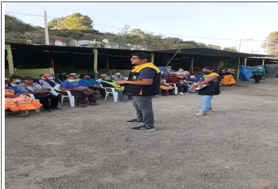
IMAGEN N° 05: ACTIVIDADES DE FOMENTO DE ASPECTOS SANITARIOS