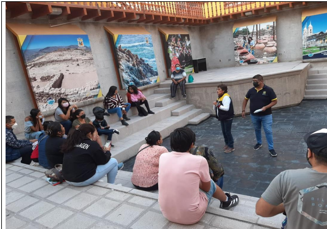
IMAGEN N° 09: ACTIVIDADES DE FORTALECIMIENTO DE LA ACTIVIDAD TURÍSTICA Y ARTESANAL EN LA PROVINCIA MARISCAL NIETO.