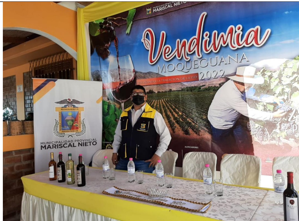
IMAGEN N° 10: ACTIVIDADES DE FORTALECIMIENTO DE LA ACTIVIDAD TURÍSTICA Y ARTESANAL EN LA PROVINCIA MARISCAL NIETO.