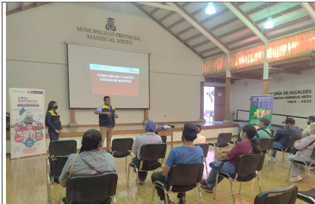
Imagen N° 01: ACTIVIDADES DE FORMALIZACIÓN DE MYPES Y EMPREDIMIENTOS LOCALES